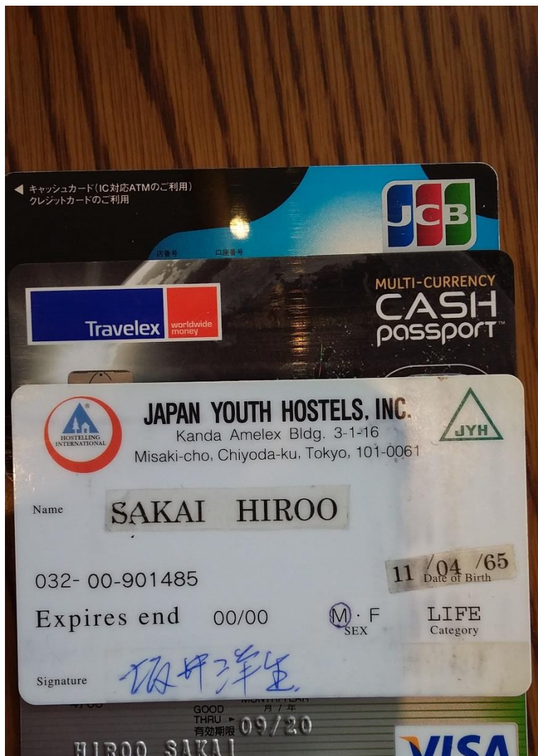
個人情報ですが！名詞！名刺！とHPと個人の都合です。