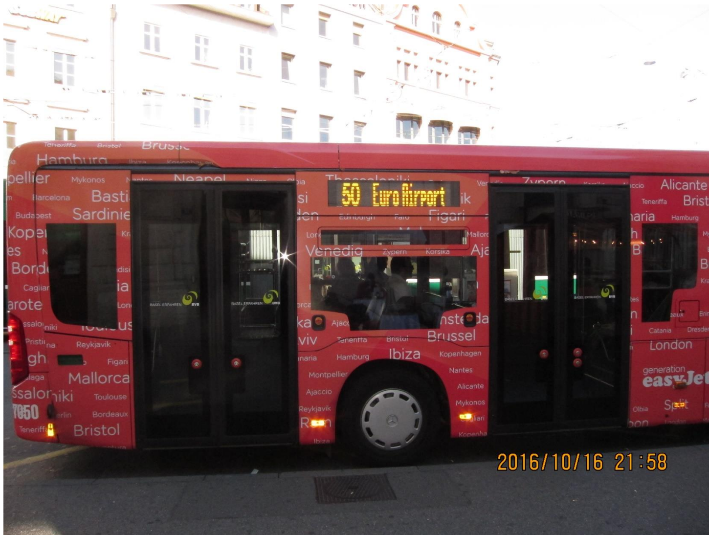
どこかの街で！駅と空港と！港！