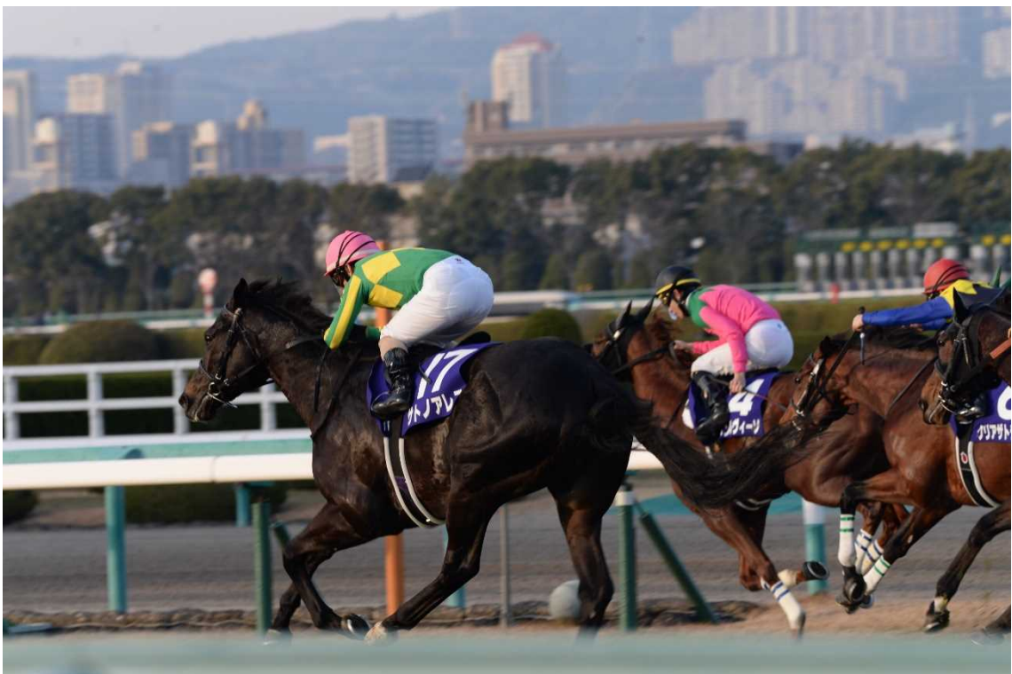
10番がおらん！最終コーナー！直線！