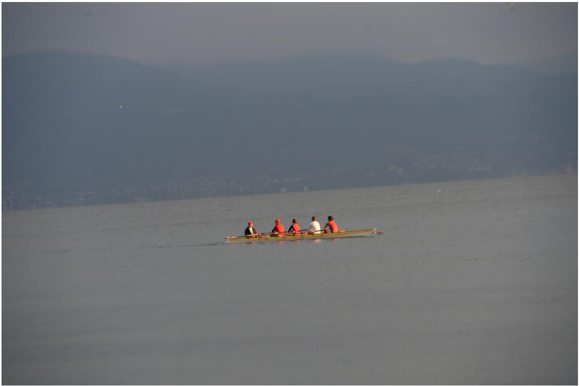
こんな一日、スペシャルサンクス！ 10月5日！