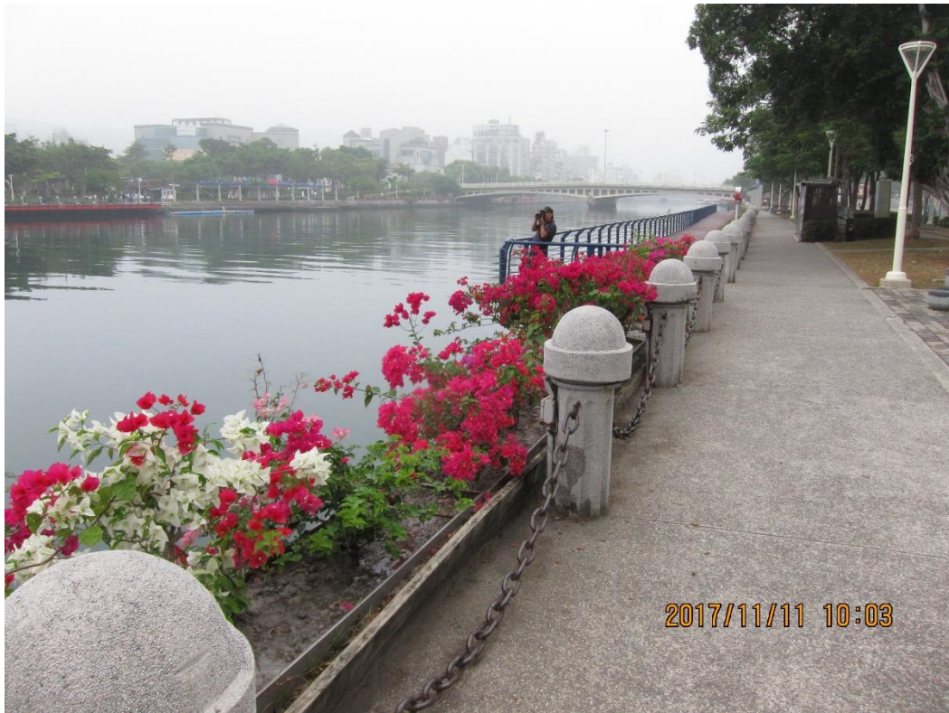
水上バスだと！水辺の回廊？？ 日付と時間！