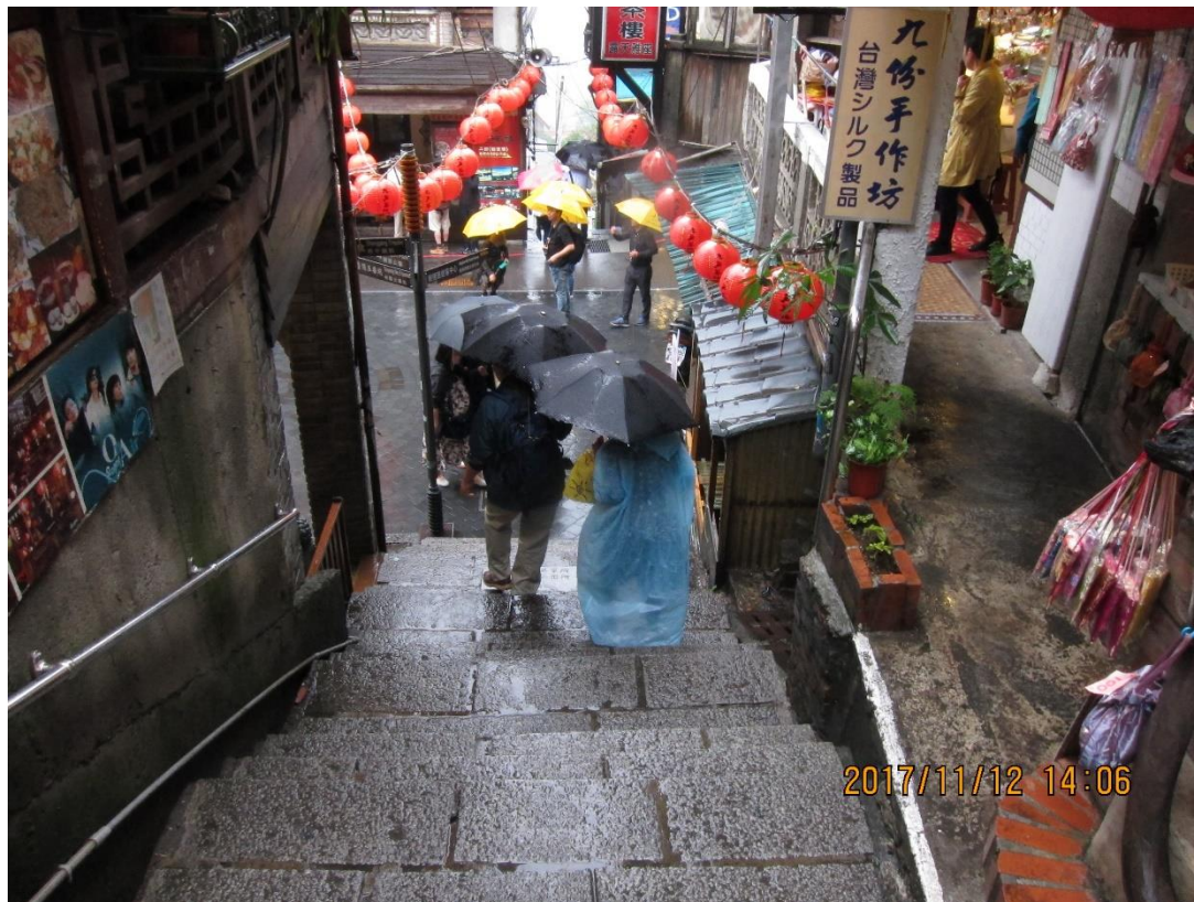
彼女たちの買い物！